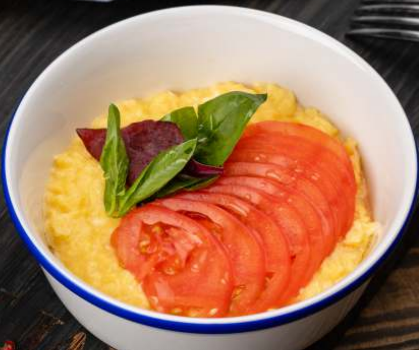
СКРЭМБЛ со спелыми помидорами Scrambled eggs with ripe tomatoes