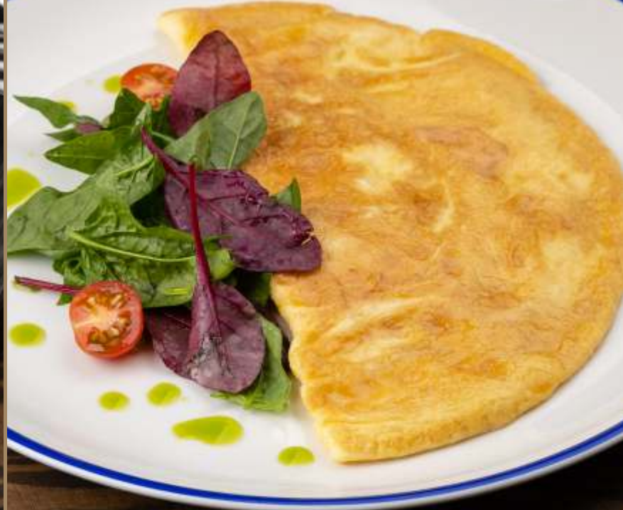
ОМЛЕТ ИЗ ТРЁХ ЯИЦ Three egg omelet